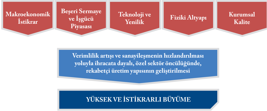
Şekil 1: Büyüme Stratejisi

444. Makroekonomik istikrar, karar alma süreçlerinin ve geleceğe dönük planların sağlıklı biçimde yapılmasına imkan tanımakta ve bu sayede ekonomide kaynakların optimal dağılımla en verimli biçimde değerlendirilmesini mümkün kılmaktadır. Son dönemde sağlanan istikrarın güçlendirilerek korunması Plan hedeflerine ulaşmak açısından ön şart olarak görülmektedir. Bu kapsamda, kamu gelir ve harcamalarında kalitenin artırılmasına yönelik çalışmalar yapılacaktır. Kamu harcamalarının toplam hâsıla içerisindeki payının artırılmamasına ve böylelikle kamunun özel sektörü dışlayıcı etkisinin en aza indirilmesine dikkat edilecektir. Verginin tabana yayılması gibi gelir artırıcı çalışmalarla oluşturulacak mali alan, yeni politikaların uygulanmasına imkân sağlayacaktır. Ayrıca, fiyat istikrarını güçlendirecek para politikası çerçevesi korunacaktır. Bunların yanı sıra, cari açığın kalıcı çözümüne yönelik politika ve önlemler hayata geçirilecektir. Bunlara paralel olarak son on yılda azalma eğilimi gösteren yurtiçi tasarrufların artırılmasına yönelik çalışmalar sürdürülecektir.